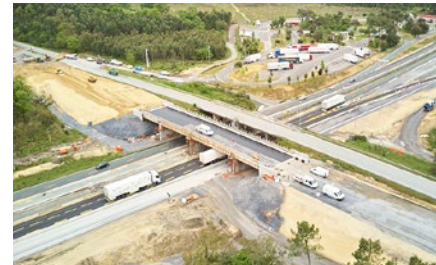
Pont de la route D 71 durant les travaux.

Le pont de la route départementale 71, qui passe au-dessus de l'autoroute, est en cours de reconstruction à côté de l'ouvrage existant.