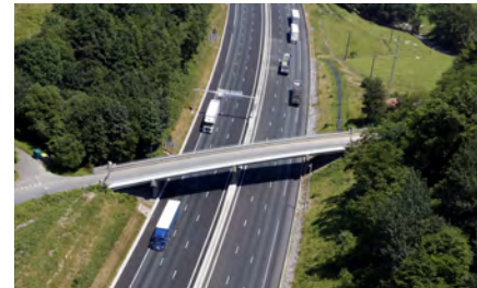
Le pont de la route de Kurleku

Le pont Larretekoborda de la route de Kurleku situé sur les communes de Biriatoou et d'Urrugne, est concerné par ces travaux.