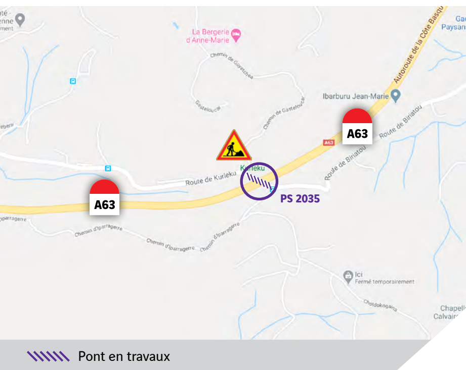
Le pont de la route de Kurleku qui passe au-dessus de l'autoroute A63

Le renforcement de la structure et le remplacement des gardes-corps par des dispositifs assurant un meilleur niveau de sécurité pour les usagers ont été réalisés cet été, permettant une réouverture à la circulation le 29 août.