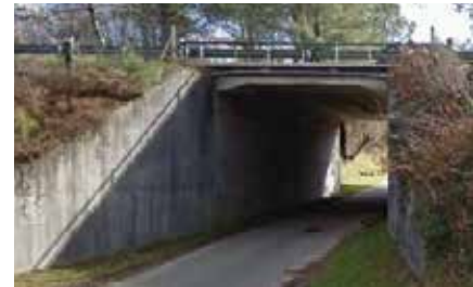
Pont du Chemin de l'Escourtille avant travaux.

Le pont du Chemin d'Escourtille , situé sur la commune de Saint Geours de Maremne, va être élargi de part et d'autre du pont existant.