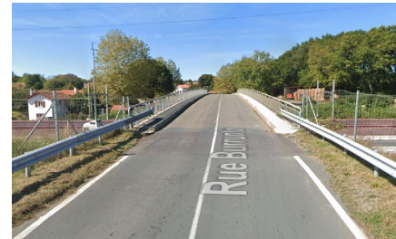
Le pont de la rue Burruntz

Le pont de la rue Burruntz, situé sur la commune de Bidart, sera concerné par ces travaux.