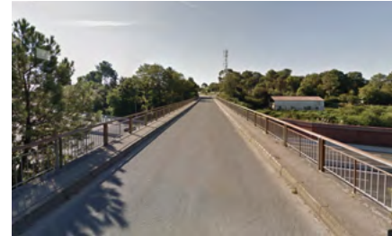
Le pont de la rue de Bassilour

Le pont de la rue de Bassilour situé sur la commune de Bidart sera concerné par ces travaux.