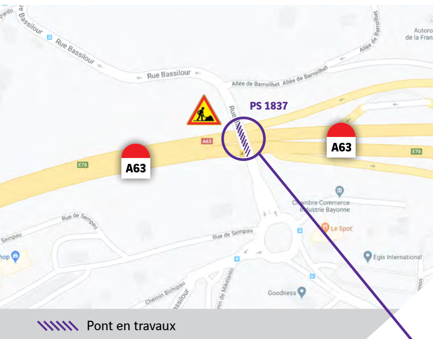
Le pont de la rue de Bassilour qui passe au-dessus de l'autoroute A63

Renforcement de la structure et remplacement des garde-corps existants par des dispositifs assurant un meilleur niveau de sécurité pour les usagers.