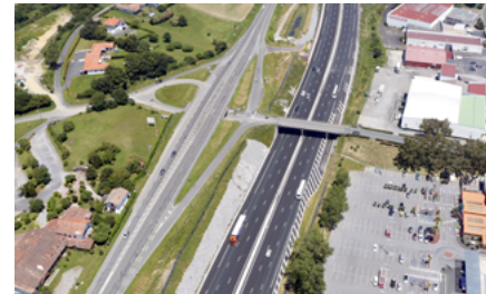
Pont du chemin de Bérain

Le pont du chemin de Bérain, situé sur la commune de Saint-Jean-de-Luz, sera concerné par ces travaux.