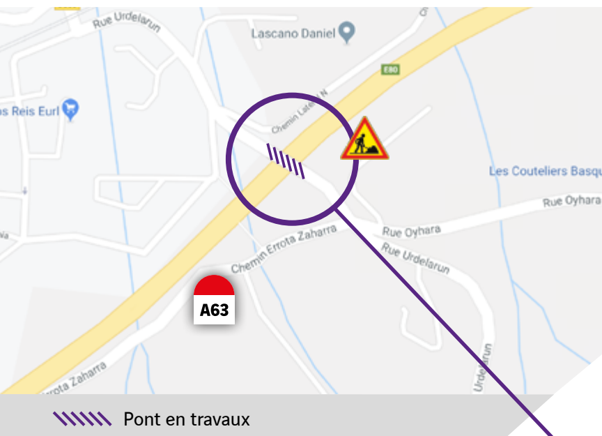
Le pont de la rue Urdelarun qui passe au-dessus de l'autoroute A63