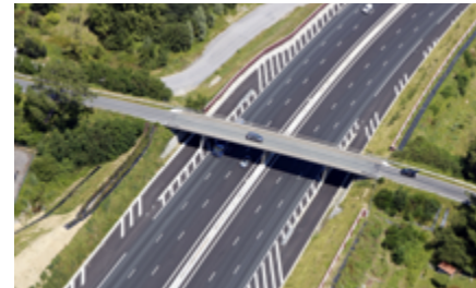
Pont de la rue Urdelarun

Le pont de la route départementale 355 situé sur la commune de Bidart sera concerné par ces travaux.