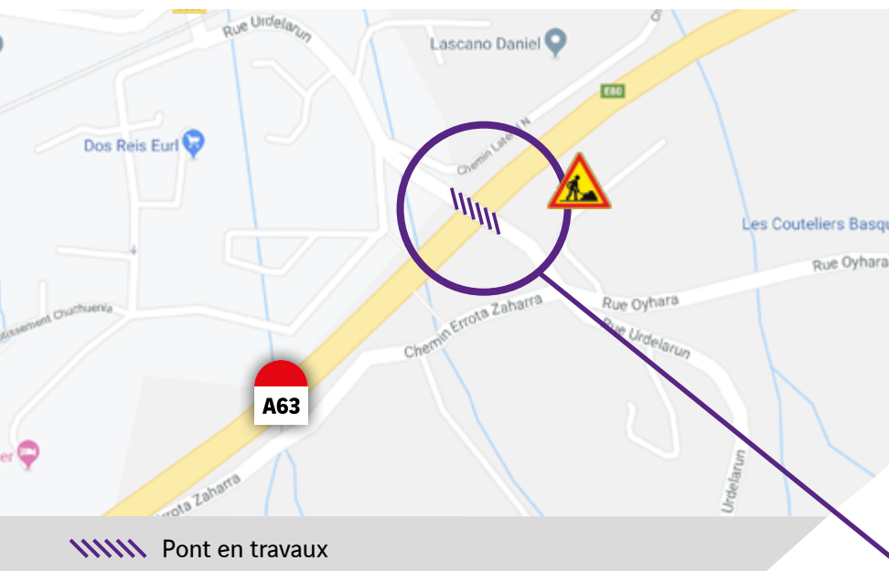
Le pont de la rue Urdelarun qui passe au-dessus de l'autoroute A63

Remplacement des garde-corps existants par des dispositifs assurant un meilleur niveau de sécurité pour les usagers.