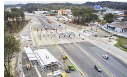
Gare de péage de Capbreton

La mise en place de l'auvent de la gare de péage de Capbreton doit être réalisée.