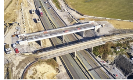
Pont du Chemin de Lamic en travaux.

Le nouveau pont du Chemin de Lamic, qui passe au-dessus de l'autoroute et se situe sur la commune de Bénesse-Maremne, a été reconstruit. L'ancien pont est prévu à la démolition.