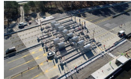
L'élargissement de la gare de péage existante

Des travaux de finition, notamment le montage au sol et la mise en place de l'auvent, ainsi que la signalisation, seront réalisés d'ici l'été.