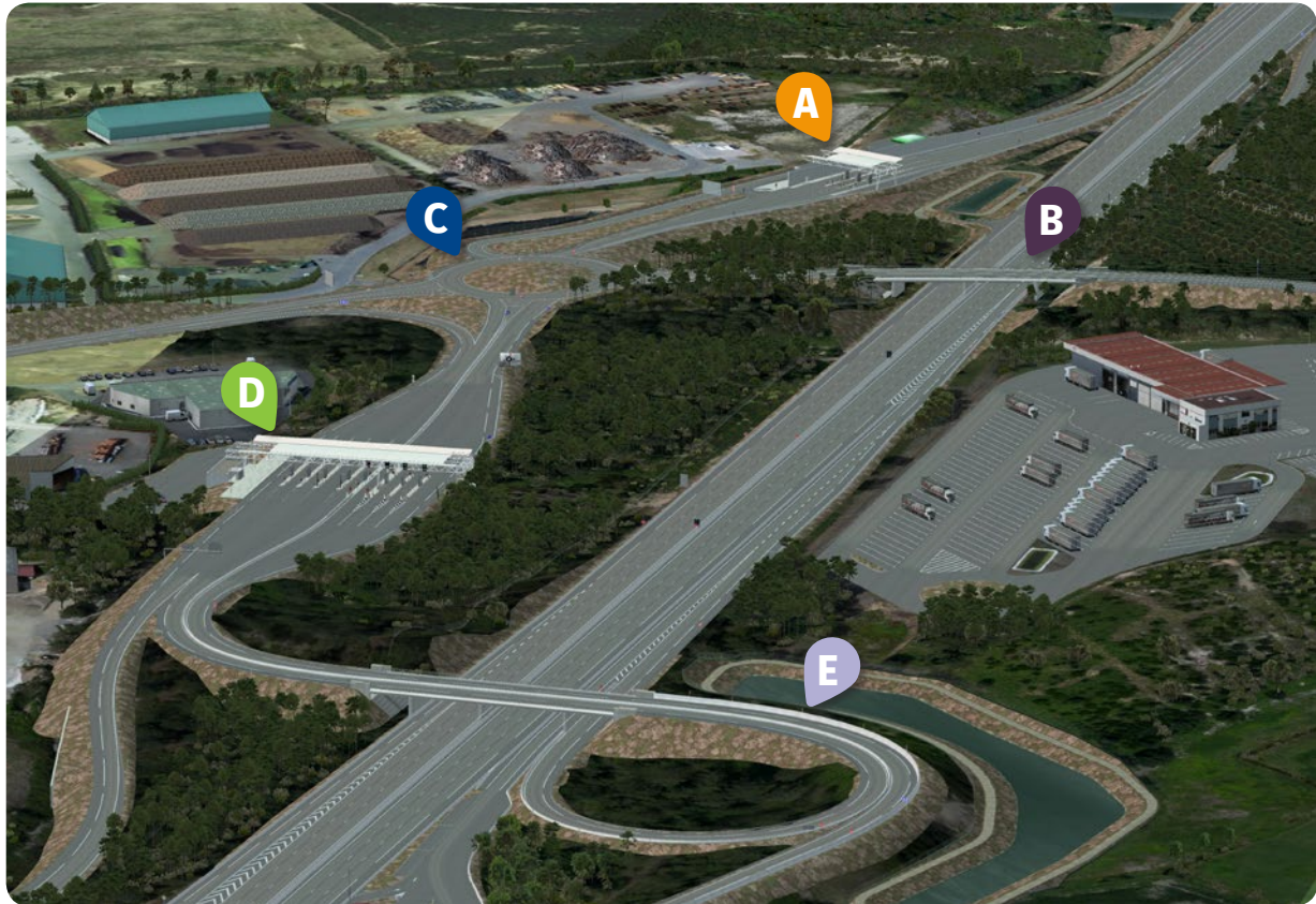
Maquette numérique de l'échangeur

FÉVRIER 2019 CAPBRETON AMÉNAGEMENTS ÉCHANGEUR N°8