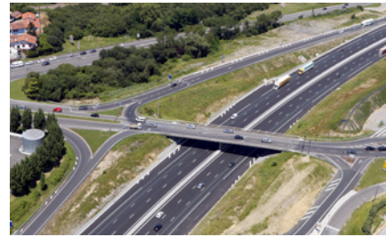
Le pont de l'avenue de Lahanchipia avant les travaux

Le pont de l'avenue de Lahanchipia situé sur la commune de Saint-Jean-de-Luz sera concerné par ces travaux.