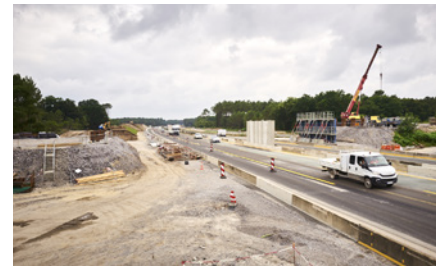
RD 337 travaux préparatoires

Le pont de la route départementale 337, situé sur la commune de Saubion, a été démoli et est en cours de reconstruction au même emplacement.