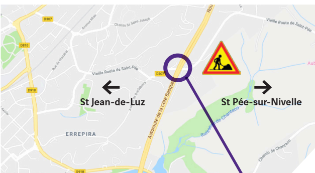
Le pont de la RD 307 qui passe au-dessus de l'autoroute A63