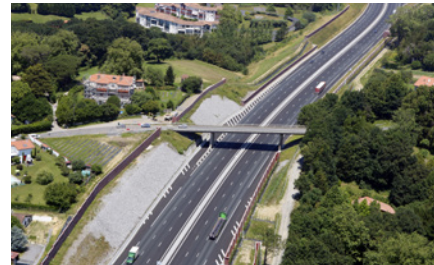
Le pont de la RD 307 avant les travaux

Le pont de la route départementale 307 situé sur la commune de Saint-Jean-de-Luz sera concerné par ces travaux.