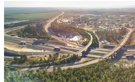
Échangeur n°9 (Saint-Geours-de-Maremne)

La fermeture d'une bretelle de l'échangeur n°9 est programmée du 19 au 23 novembre pour permettre les travaux de chaussées définitives (préparation de la structure, enlèvement des couches supérieures du revêtement, pose du nouveau revêtement).