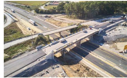
Pont de la route D 465 durant les travaux

Le pont de la route départementale 465, qui passe au-dessus de l'autoroute, est en cours de reconstruction à côté de l'ouvrage existant.