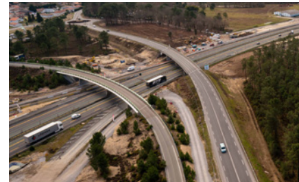
Le pont de la RD 810 avant travaux.

Le pont de la RD 810, situé sur la commune de Saint-Geours-de-Maremne, qui passe au-dessus de l'autoroute, fait l'objet de travaux d'aménagement qui nécessitent sa fermeture pendant 3 mois.