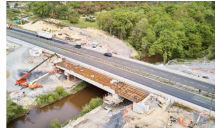
Ouvrage de franchissement du Boudigau

Le pont permettant le franchissement de l'A63 par le cours d'eau du Boudigau, situé sur la commune de Labenne, est en train d'être élargi de part et d'autre de l'ouvrage existant.