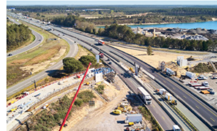
Pont de la D 824 durant les travaux.

Le pont de la route départementale 824, situé sur la commune de Saint-Geours-de-Maremne, a été démoli et est en cours de reconstruction au même emplacement.