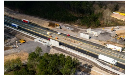
Route des Monts durant les travaux.

Le pont de la route des Monts qui passe au-dessus de l'autoroute, situé sur la commune de Saint-Geours-de-Maremne, a été démoli et est en cours de reconstruction au même emplacement.