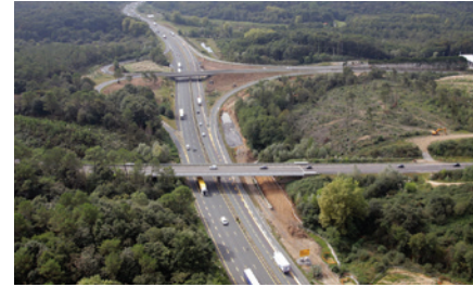
Échangeur n°7 (Ondres) avant travaux.

La fermeture d'une bretelle de l'échangeur n°7 est programmée la nuit du 25 février 2019 pour permettre des travaux de réparation de chaussées.