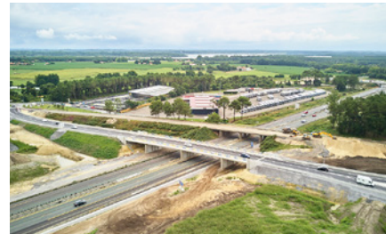
Le nouveau pont de la RD 28

À l'occasion de la démolition du pont existant, l'autoroute A63 sera fermée à la circulation (voir détail au verso).