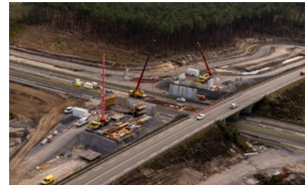
Pont de la route D 112 durant les travaux

La reconstruction du pont de la route départementale 112, qui passe au-dessus de l'autoroute, est en cours d'achèvement. La démolition de l'ouvrage existant a été réalisée la nuit du 12 septembre 2018.