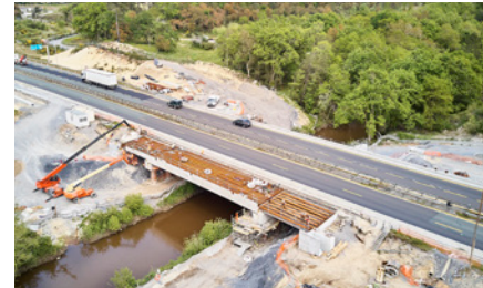
Ouvrage de franchissement du Boudigau

Le pont permettant le franchissement de l'A63 par le cours d'eau du Boudigau, situé sur la commune de Labenne, est en train d'être élargi de part et d'autre de l'ouvrage existant.