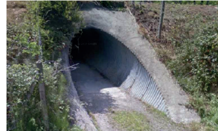
Pont du Chemin de Téoulère avant travaux.

Le pont du Chemin de Téoulère , situé sur la commune de Benesse Maremne, va être élargi de part et d'autre du pont existant.