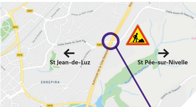
Le pont de la RD 307 qui passe au-dessus de l'autoroute A63