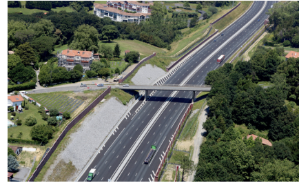
Le pont de la RD 307 avant les travaux

Le pont de la route départementale 307 situé sur la commune de Saint-Jean-de-Luz sera concerné par ces travaux.