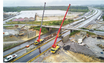
Exemple d'un pont durant les travaux

Quelques coupures ponctuelles de l'A63 sont donc à prévoir pour permettre la pose des corniches des nouveaux ponts ainsi que la mise en place du balisage (équipements de sécurité, panneaux provisoires et marquage jaune au sol).