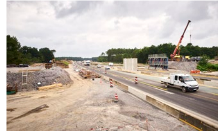
RD 337 travaux préparatoires

Le pont de la route départementale 337, qui passe au-dessus de l'autoroute, va être démoli puis reconstruit au même emplacement.