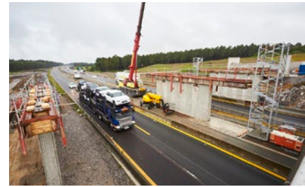
Pont du chemin du Poun de Burry durant les travaux

Le pont du chemin du Poun de Burry, situé sur la commune de Saint-Vincent-de-Tyrosse, est en cours de reconstruction à côté de l'ouvrage existant.