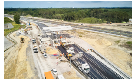
Construction de la nouvelle bretelle de sortie

Par ailleurs, le nouveau pont de la RD 28 ( phase 1B ) et le giratoire ( phase 1C ) ont été mis en service au début du mois de juillet. L'élargissement de la gare de péage existante se poursuit jusqu'en début d'année 2019.