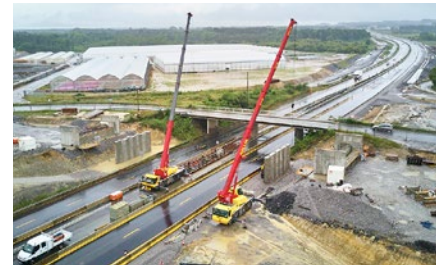
Pont de la route D 465 durant les travaux

Le pont de la route départementale 465, qui passe au-dessus de l'autoroute, est en cours de reconstruction à côté de l'ouvrage existant.