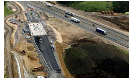
Construction de la nouvelle bretelle de sortie

Dans le cadre de l'élargissement de l'autoroute A63 et pour l'amélioration de la sécurité et du confort des usagers, l'échangeur de Capbreton est intégralement réaménagé : création d'une nouvelle bretelle de sortie, élargissement de la gare existante et modification du raccordement de l'échangeur à la route départementale 28.