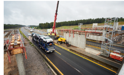
Pont du chemin du Poun de Burry durant les travaux

Le pont du chemin du Poun de Burry, situé sur la commune de Saint-Vincent-de-Tyrosse, est en cours de reconstruction à côté de l'ouvrage existant.