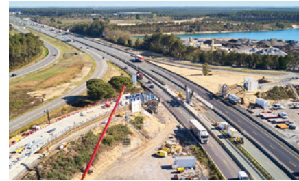
Pont de la D 824 durant les travaux.

Le pont de la route départementale 824, situé sur la commune de Saint-Geours-de-Maremne, a été démoli et est en cours de reconstruction au même emplacement.