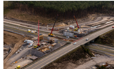
Pont de la route D 112 durant les travaux

Le pont de la route départementale 112, qui passe au-dessus de l'autoroute, va être rétabli à côté de l'ouvrage existant.