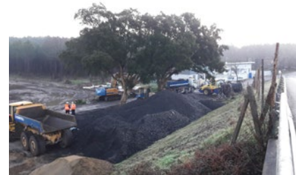
RD 337 travaux préparatoires

Le pont de la route départementale 337, qui passe au-dessus de l'autoroute, va être démolé puis reconstruit au même emplacement.